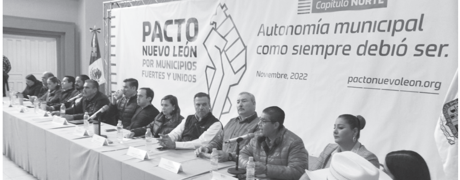
Dentro de los Municipios más fuertes del área metropolitana se encuentra Juárez N.L. y el que esta al frente es el Alcalde Lic. Francisco Héctor Treviño Cantú quien se hizo presente en este importante evento respaldando también a sus homólogos y haciendo mención que el Municipio que él gobierna, también ha sido muy afectado por las decisiones mal tomadas en el Gobierno del Estado, él manifestó que una de sus preocupaciones más importantes es la recolección de basura ya que no al llegar a tiempo el recurso se atrasan en los pagos a la empresa que brinda este importante servicio público