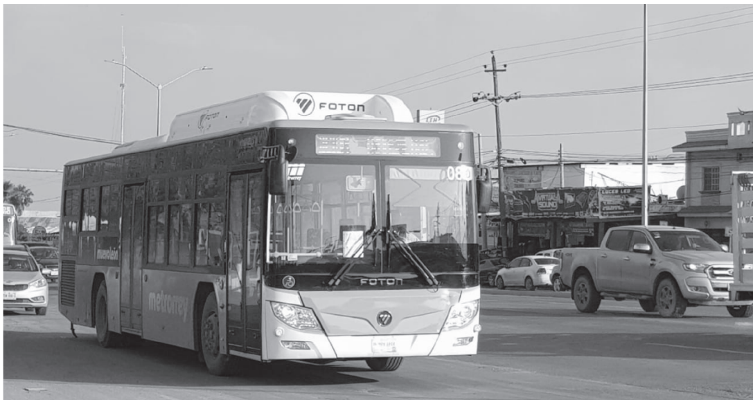
En la gráfica aparece una de las nuevas unidades de transporte que brinda el servicio a los ciudadanos juarenses, ya que tanta falta hacía.