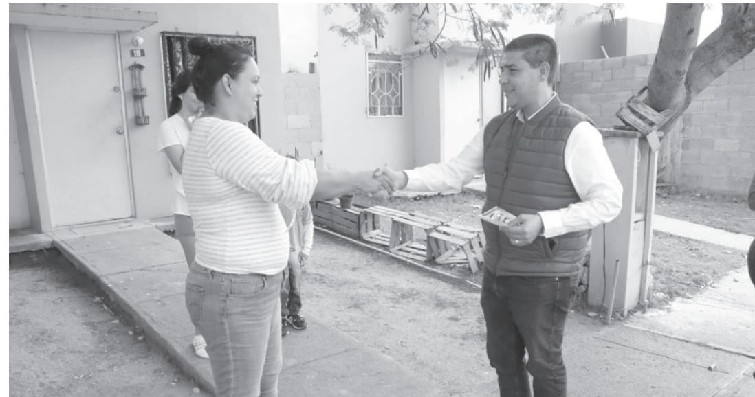
Casa por casa el alcalde juarense Lic. Francisco Treviño Cantú, recordando los tiempos de campaña ahora agradece y corresponde a la confianza con nuevas líneas de transporte y unidades a la altura de todos los ciudadanos

"Viene desde la Estación Exposición hasta aquí al centro de la Juárez, al monumento. "(Esta ruta) fue una gestión que realizamos ante el Gobierno del Estado. Necesitamos difundirlo más en redes sociales, en noticieros, para que la gente sepa cuáles son las paradas que tiene el Transmetro, costos, etcétera", señaló el Alcalde.